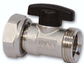
pro typ CS 501 NK