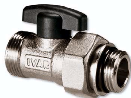
pro typ CS 501 N